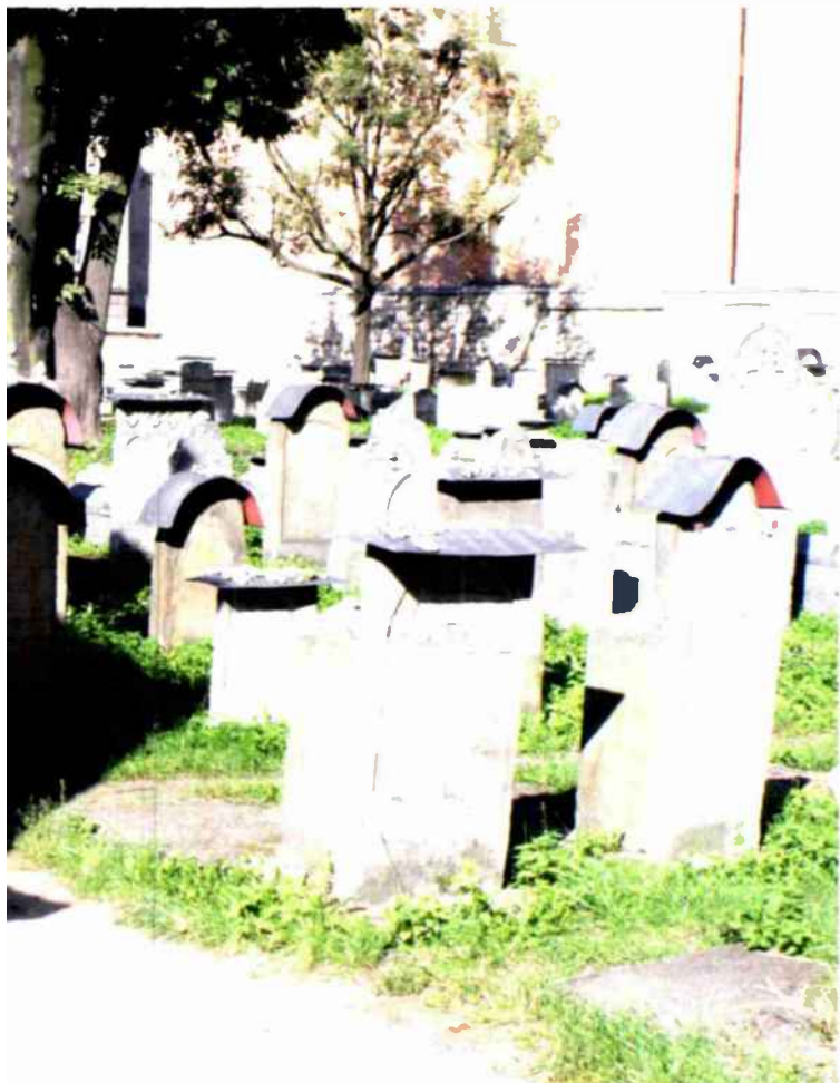
ברחובות הסמוכים, מול בית הקברות מתרחש נס: טל של תחייה זולג על יהדות מוסתרת ומוחבאת, הקמה מן העפר. בוקעת את המציבה, מתאוששת מן המלחמה והשלכותיה