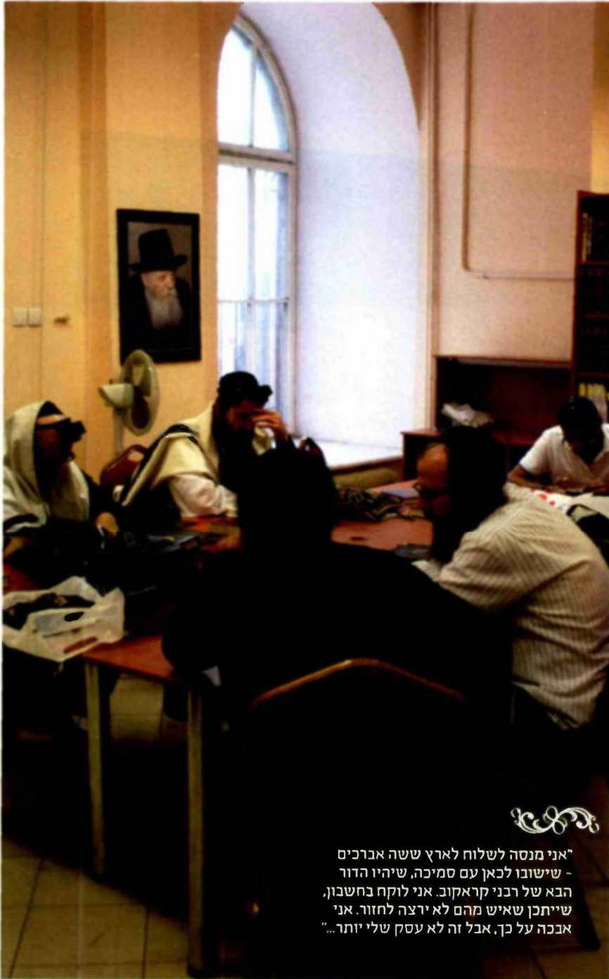
"אני מנסה לשלוח לארץ ששה אברכים - שישובו לכאן עם סמיכה, שיהיו הדור הבא של רבני קראקוב. אני לוקח בחשבון, שיתכן שאיש מהם לא ירצה לחזור. אני אבכה על כך, אבל זה לא עסק שלי יותר..."